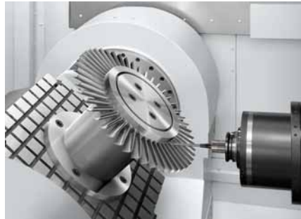
图4. 航空機部品加工事例