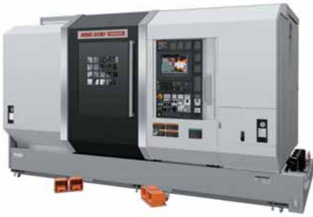
外觀 (NZ2000 T3Y3)