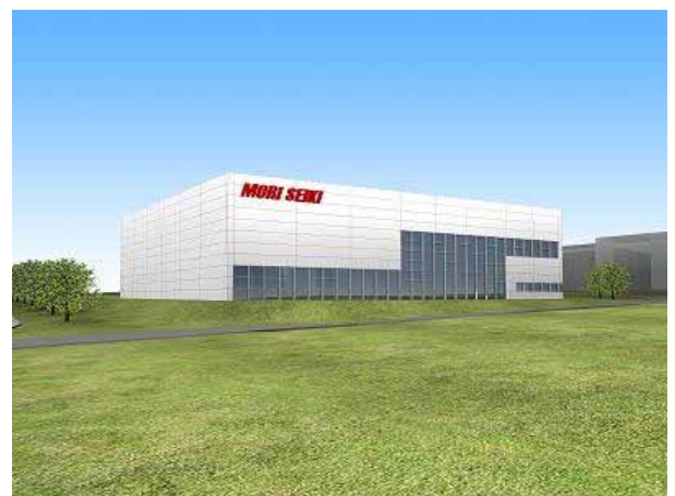
ケムニッツテクニカルセンタ完成予想図