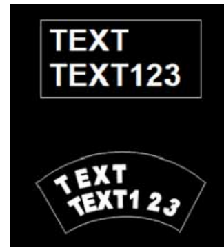
図2. 設定画面例(文字の配置)