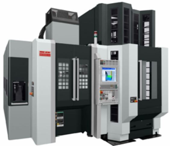
図 3. AWC 仕様