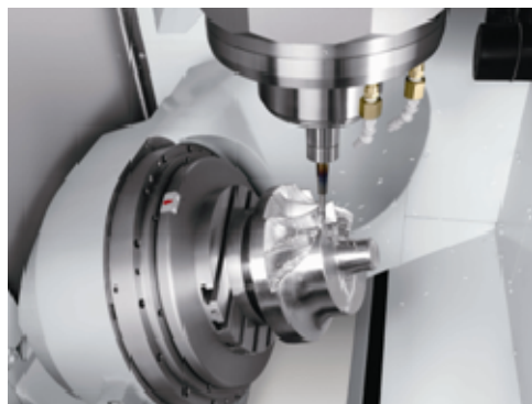
図 4. 加工事例(インペラ)