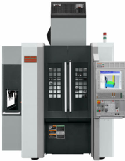
図 1. 外観